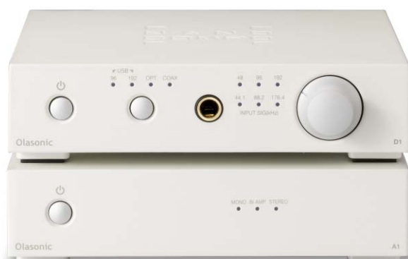
NANO-A1 と NANO-D1 の組合せ